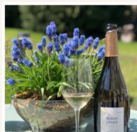
Coco wine (7日のみ)