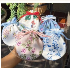
covaco x cerisier ハンドメイドショップのこ